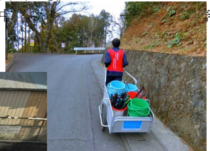
*リアカーで道具の運搬